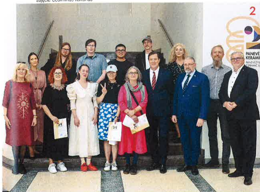
Zdjęcie: Gediminas Kartanas